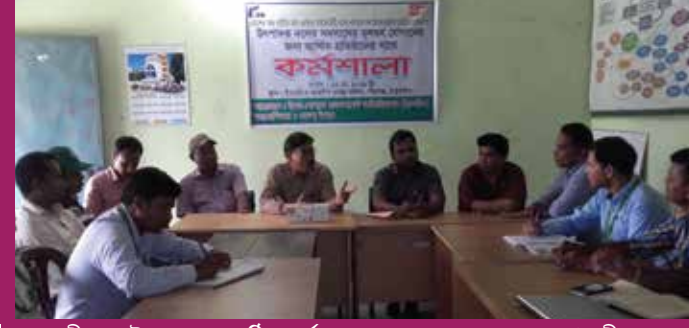
পীরগঞ্জ উপজেলায় অনুষ্ঠিত কর্মশালায় মুক্ত আলোচনায় অংশগ্রহণকারীবৃন্দ

ইএসডিও'র বাস্তবায়নে হেকস/ইপার এর সহযোগিতায় প্রেমদীপ প্রকল্পের উৎপাদক দলের সদস্যদের মূলধন যোগানের জন্য সরকারি দপ্তর, ব্যাংক ও বিভিন্ন ক্ষুদ্র আর্থিক প্রতিষ্ঠানের প্রতিনিধিবৃন্দের সাথে কর্মশালা অনুষ্ঠিত হয়। গত ১৩ মে ঠাকুরগাঁও'র পীরগঞ্জ উপজেলায় এবং ৮ মে রাণীশংকৈল উপজেলায় এই কর্মশালা দু'টি অনুষ্ঠিত হয়।